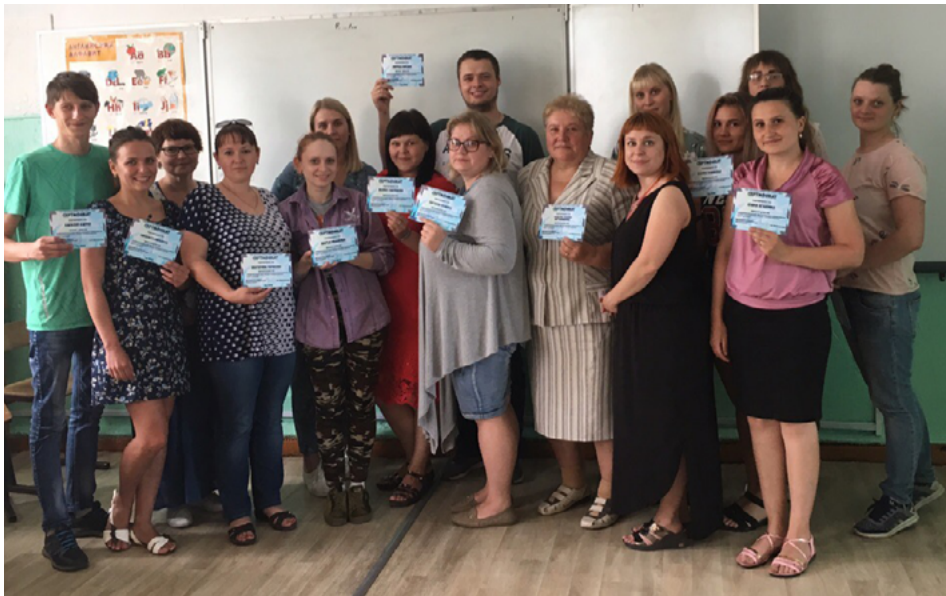
Участники проектной школы

С 10 по 13 июня на территории Уярского района проходила проектная школа для молодых специалистов в рамках реализации проекта «Сегодня - молодой специалист, завтра - наставник».