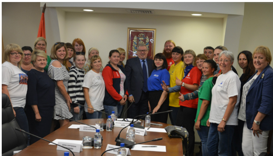
Встреча с Губернатором края Виктором Толоконским

Красноярская краевая организация Профсоюза выражает благодарность министерству образования Красноярского края, а также краевому центру туризма и краеведения за помощь в организации и проведении мероприятия.