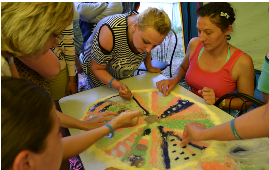
Мастер-класс «Мандала-терапия» на Тепсее

Красноярского края «Тепсей». Фестивальная поляна объединила талантливых, творческих и активных людей. Всего, в мероприятии приняли участие почти 300 работников образования с разных муниципальных образований нашего края. Проект осуществляется краевым Домом работников просвещения, при поддержке министерства образования Красноярского края и Красноярской территориальной (краевой) организации Профсоюза работников народного образования