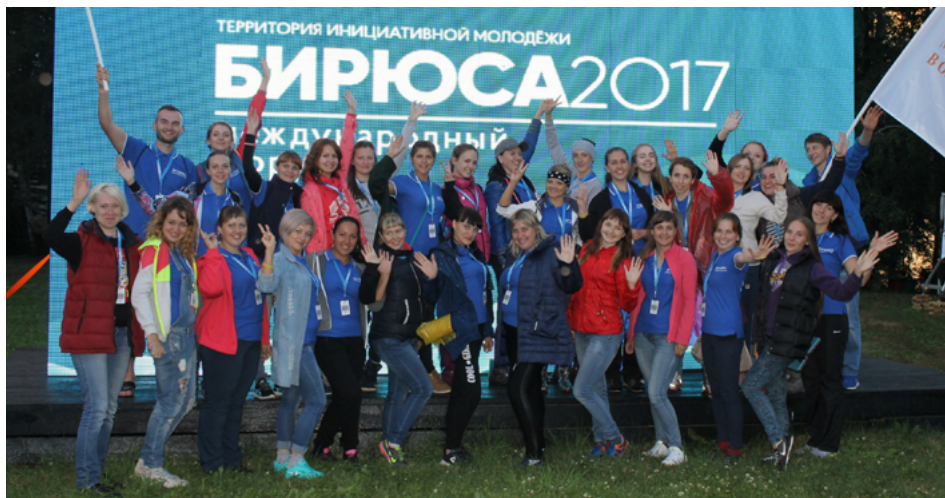
Молодые педагоги на ТИМ "Бирюса"

С 8 по 14 июля проходила первая смена международного форума территория инициативной молодежи «Бирюса - 2017», «Молодые профессионалы». Смена объединила на одной площадке более 800 молодых специалистов различных сфер из 23 регионов России и 4 зарубежных стран. В одной из дружин были собраны молодые педагоги со всего Красноярского края. Смена была направлена на содействие формированию единого пространства для развития профессиональных сообществ, организацию взаимодействия потенциального работодателя и работника. Помимо участия в традиционных «бирюсинских» мероприятиях перед педагогами стояла задача подготовки проектов для защиты на краевом августовском педагогическом совете. Напомним, что проекты, прошедшие общественно-профессиональную экспертизу, получают грантовую поддержку от министерства образования края до 500 000 рублей.