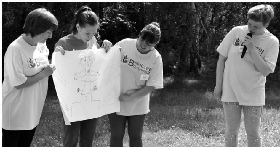
Участники проекта "Эффект команды"

В июне в Богучанском районе проходила «Летняя школа педагога «Вместе в будущее». Школа стала заключительным этапом районного конкурса «Эффект команды», проходившего в течение учебного года. Цель проекта – создание эффективных командных соорганизаций в образовательных учреждениях района. На базе детского оздоровительного лагеря «Березка» собрались финалисты конкурса: педагоги Артюгинской, Красногорьевской, Невонской, Шиверской школ и Богучанского детского сада №7 «Буратино». Для участников школы была подготовлена образовательная программа: семинары, квест-игра, мастер-классы, дискуссии, сеансы арт-