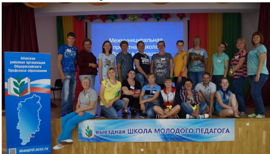
Участники проектной школы "Взгляд в будущее"

С 1 по 4 июля 2017 года в Минусинском районе на территории Потрошиловского бора, напротив горы Тепсей, в девятый раз прошел Открытый краевой фестиваль творческих и общественных объединений работников образования