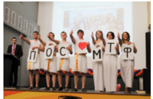
Домашнее задание ПОС МТФ

Первым конкурсным испытанием стало "Домашнее задание". Сильнейшими в этом этапе стали три команды из СФУ (1 место - факультет энергетики, 2 место - механико-технологический факультет, 3 место -