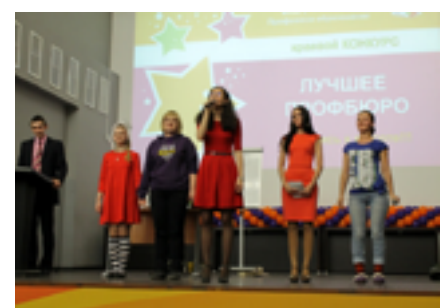
Команда ИСГТ КГПУ им.В.П.Астафьева