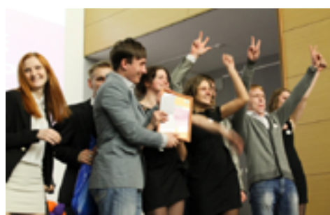
Победители конкурса, команда ПОС МТФ СФУ