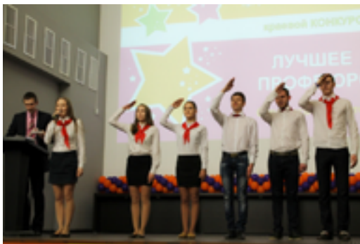
Домашнее задание. Команда ФППС СибГТУ

Борьба продолжилась в конкурсе "Брейн-ринг". Команды прошли серьезную проверку на знание основных направлений деятельности Общероссийского Профсоюза образования и особенностей защиты прав студентов. Лучшей в этом конкурсе стала команда механико-технологического факультета СФУ.